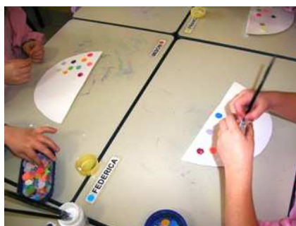
Cappellini realizzati con cartoncino e coriandoli!