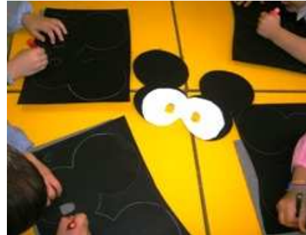
BAMBINI DI 3 ANNI SEZ. F Maschere da topolino punteggiate e pitturate