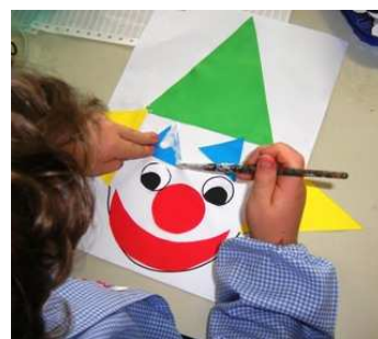
Pagliaccio con le forme geometriche