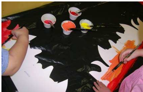
BAMBINI DI 5 ANNI