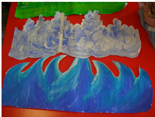
D E G