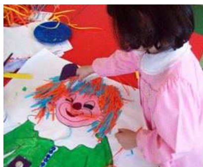
Grande pagliaccio con collage di carta e pittura